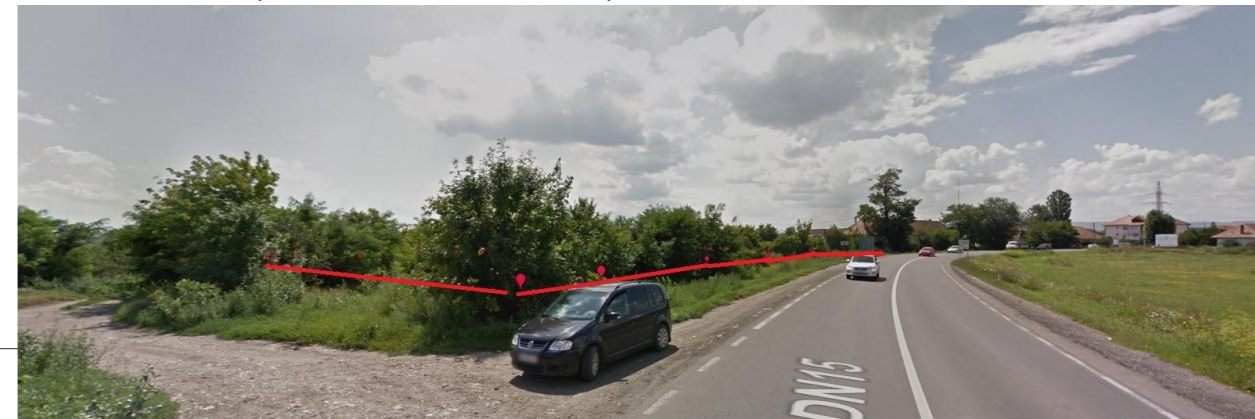
DN15 PARCELA IN STUDIU VEDERE DIN SPRE CAMPIA TURZII