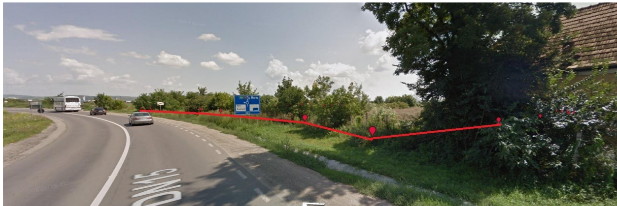
DN15 PARCELA IN STUDIU VEDERE DIN SPRE TURDA

CONSTRUIRE CONSTRUIRE HALĂ METALICĂ CU FUNCȚIUNE COMERȚ, CORT DEPOZITARE, AMENAJĂRI EXTERIOARE, ANEXE TEHNICE, REȚELE EXTERIOARE, ÎMPREJMUIRE, SEMNALISTICĂ EXTERIOARĂ